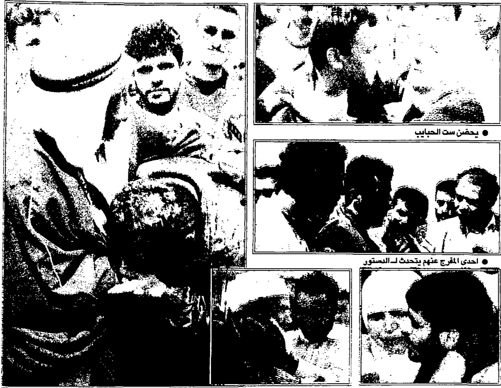
● فرحة الام بطفلات الاكباد ● مع والده بعد طول فراق ● يقبل بيدي والده ● تصوير: جورج كززيان